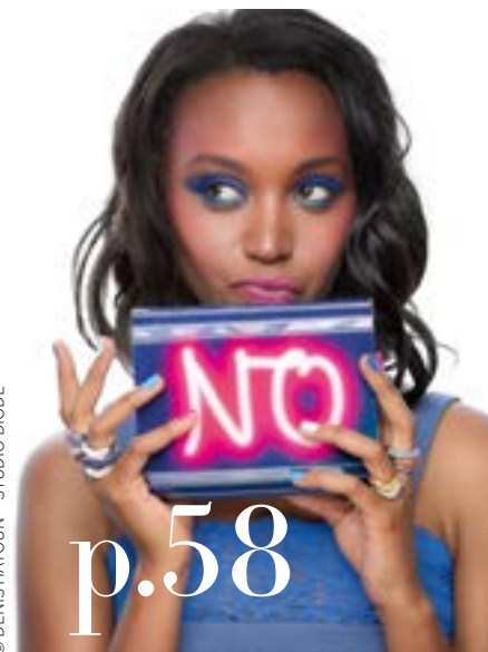
© DENIS HAYOUN - STUDIO DIODE